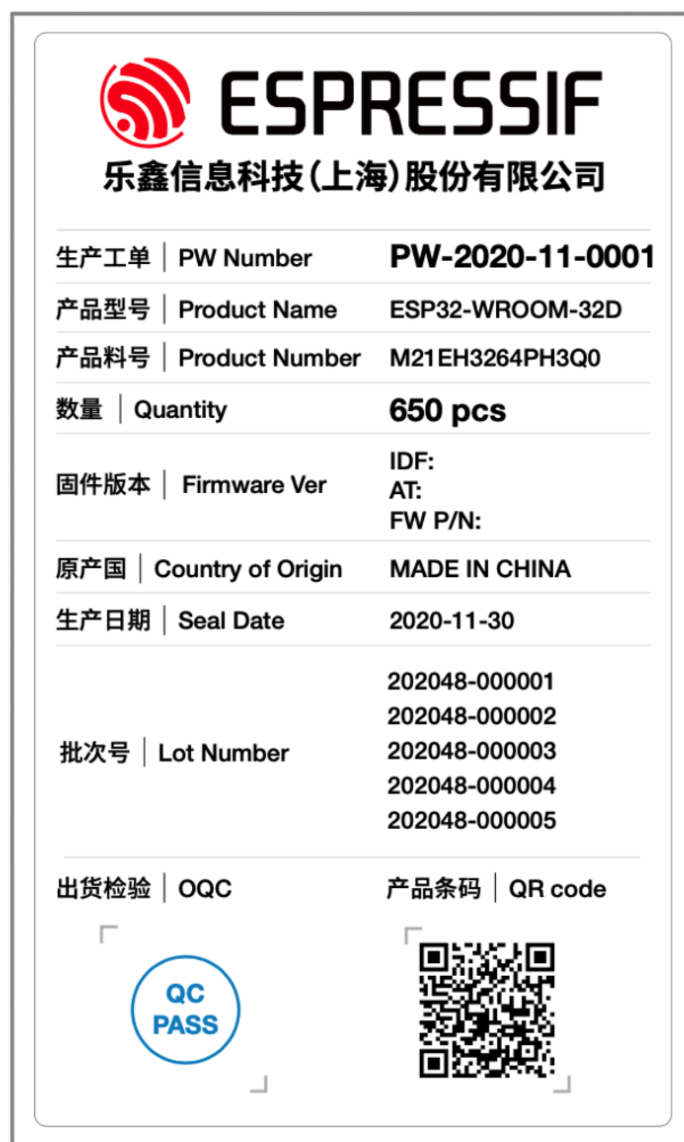
图 1.3: 模组物料标签

备注: 注意, 仅装在铝箔袋中的模组卷盘含有 生产工单 (PW Number) 信息。